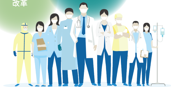
タスクシフトで効率的な手術運用

離職 人手不足 教育時間 の不足 働き方 改革 医療の進化に 伴う手術管理 物品の増加