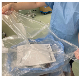
プレミアムキット