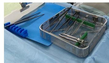
イージーフィット + バスケット